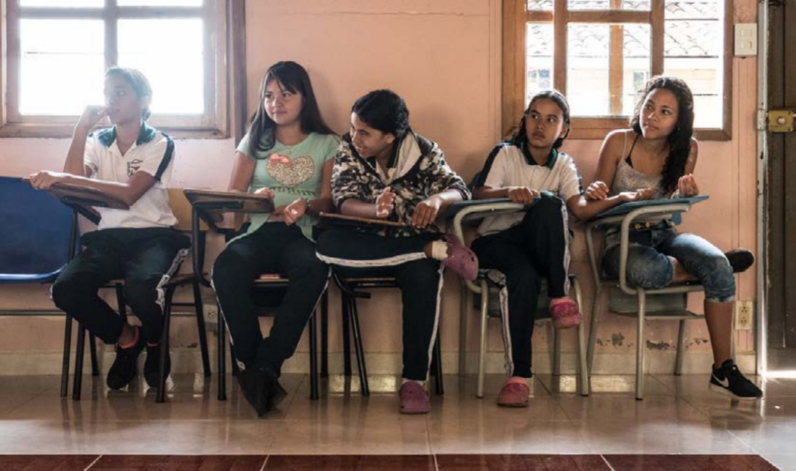
In der Ciudad Don Bosco wird gemeinsam gelernt und gelacht.

„Wir können die Alltagssorgen der Kids hier oft ausblenden, wir sorgen ja für Ablenkung in ihrem Leben.“