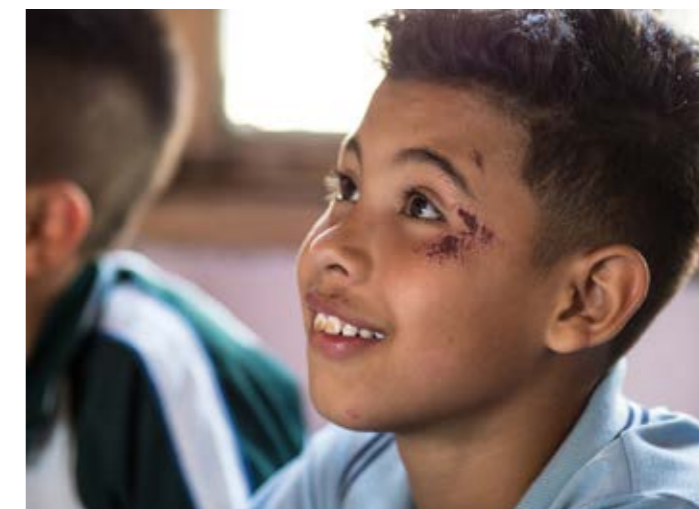
Jedes Kind wird bei Don Bosco ernst genommen und gefördert.